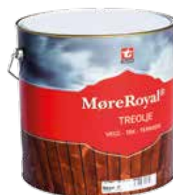
MøreRoyal® TRÄOLJA FÖR VÄGG, TAK OCH KAPYTOR

Komihåg att alla penslar och roller etc. måste brännas/läggas i vatten för att förhindra självantändning.