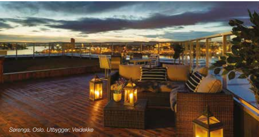
Sorenga, Oslo. Utbygger: Veidekke

KONTAKTA OSS och snacka med vår projektansvarig för offert och vägledning.