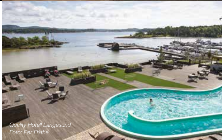
Quality Hotell Langesund