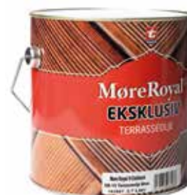
MøreRoyal® EXKLUSIV TRALOLJA