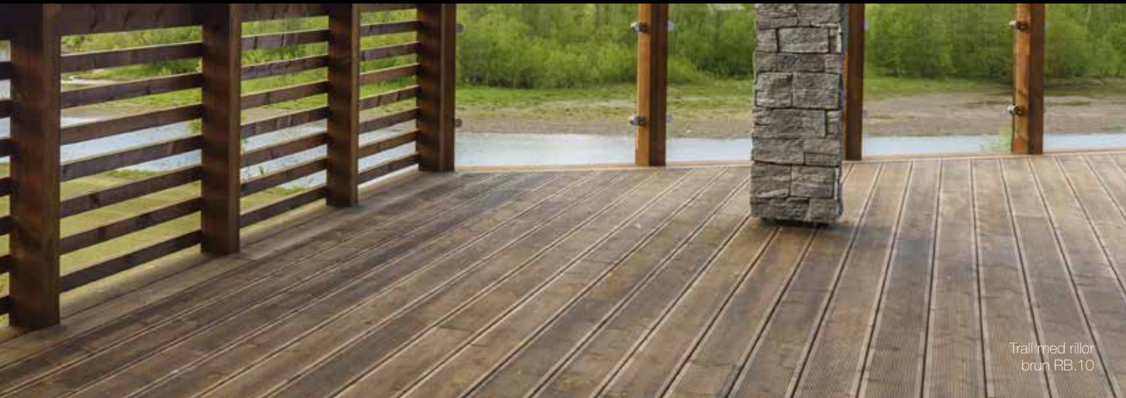
Trall med rillor brun RB.10