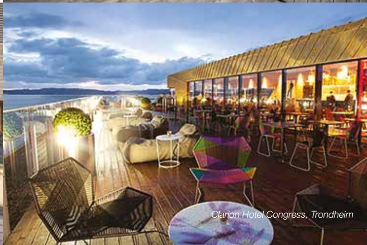
Clarion Hotel Congress, Trondheim