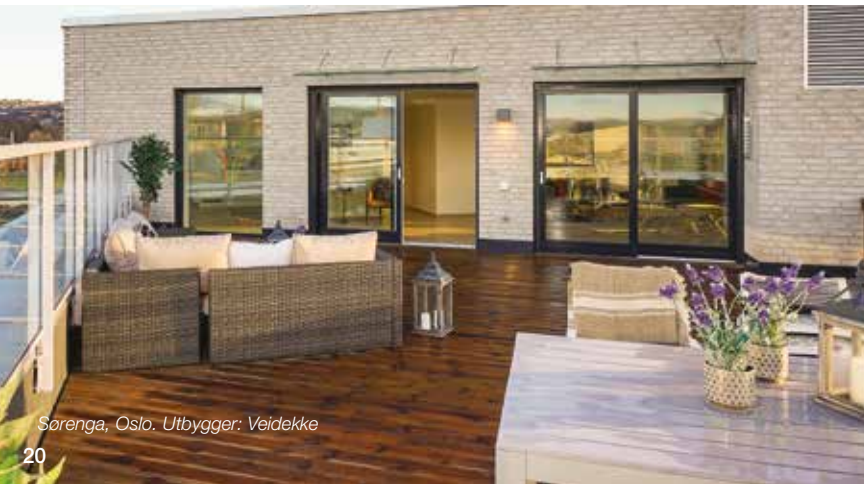
Sorenga, Oslo. Utbygger: Veidekke