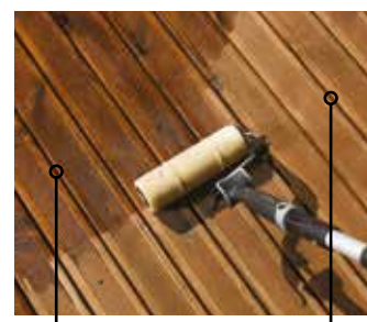
MøreRoyal® brun som den framstår som ny