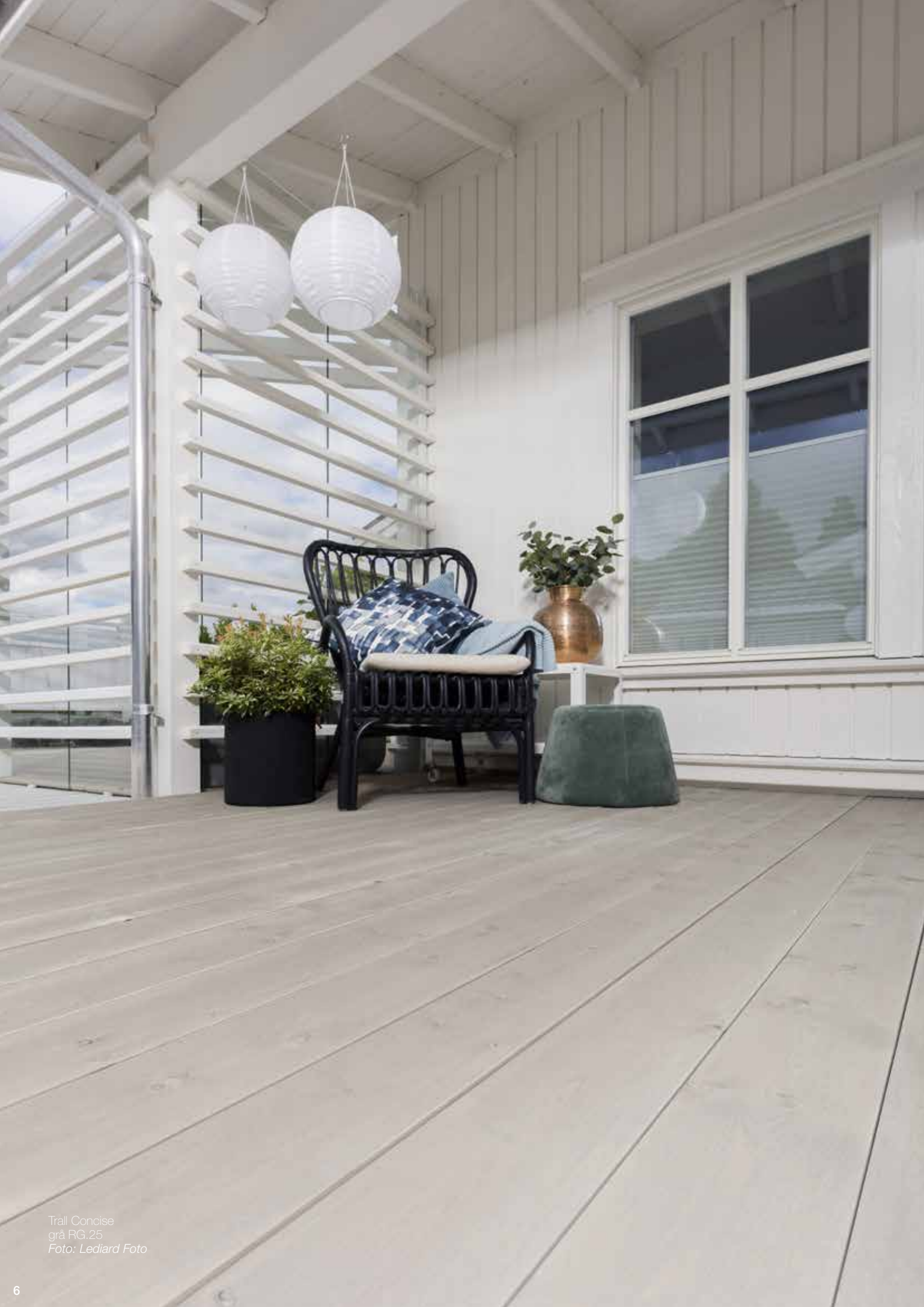
Trall Concise grå RG.25