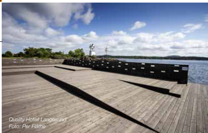
Quality Hotell Langesund