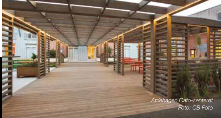
Atrihagen Cato-senteret